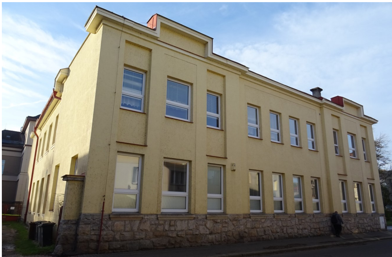
obr. 1 Pohled na severní stěnu posuzovaného objektu