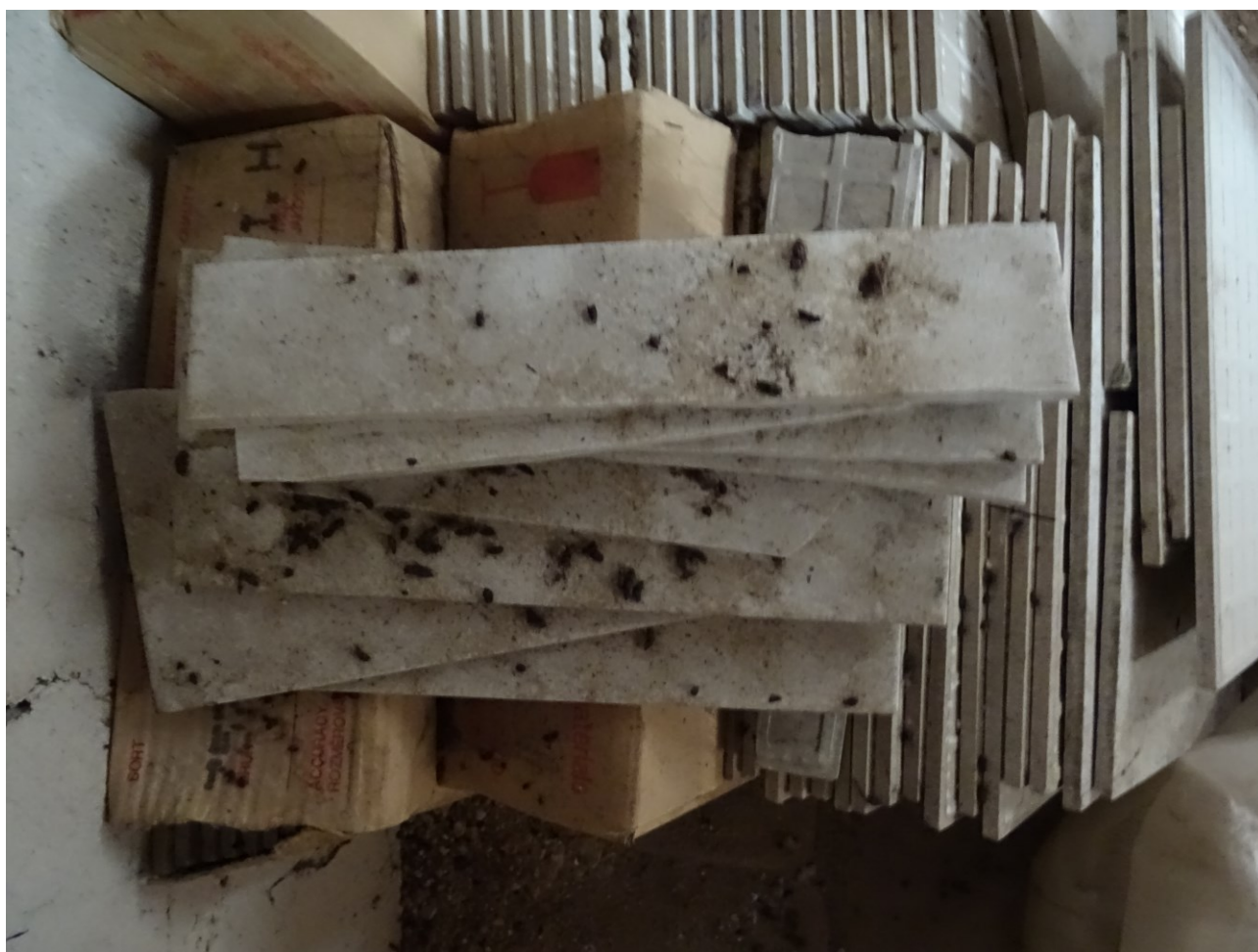
obr. 6 Starší trus většího druhu netopýra nalezený na půdě