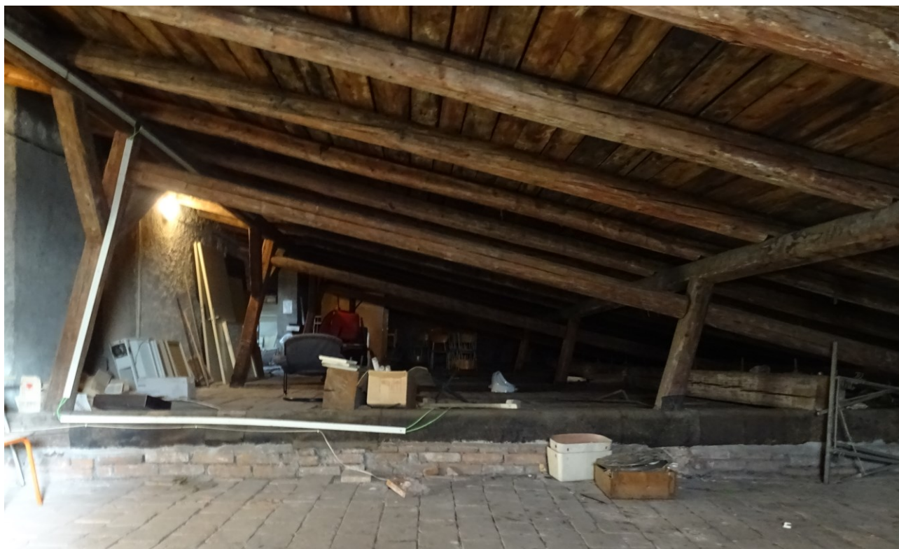
obr. 5 Podstřešní (půdní) prostory posuzovaného objektu