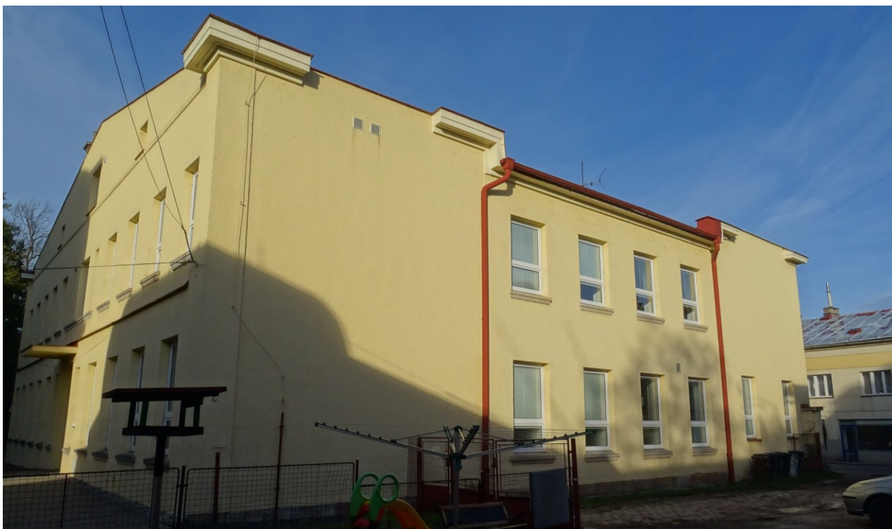
obr. 3 Pohled na východní stěnu posuzovaného objektu