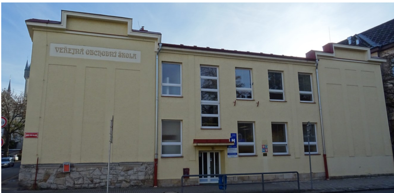
obr. 4 Pohled na západní stěnu posuzovaného objektu