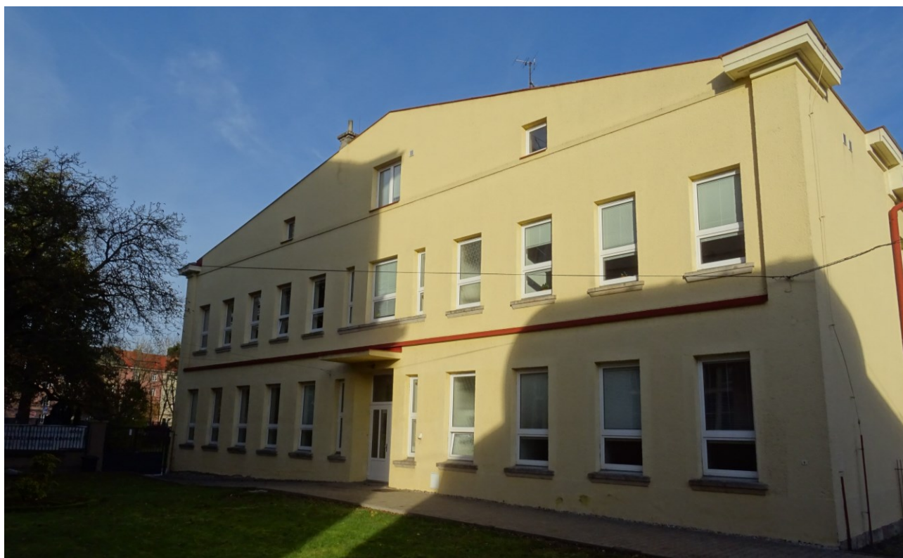
obr. 2 Pohled na jižní stěnu posuzovaného objektu